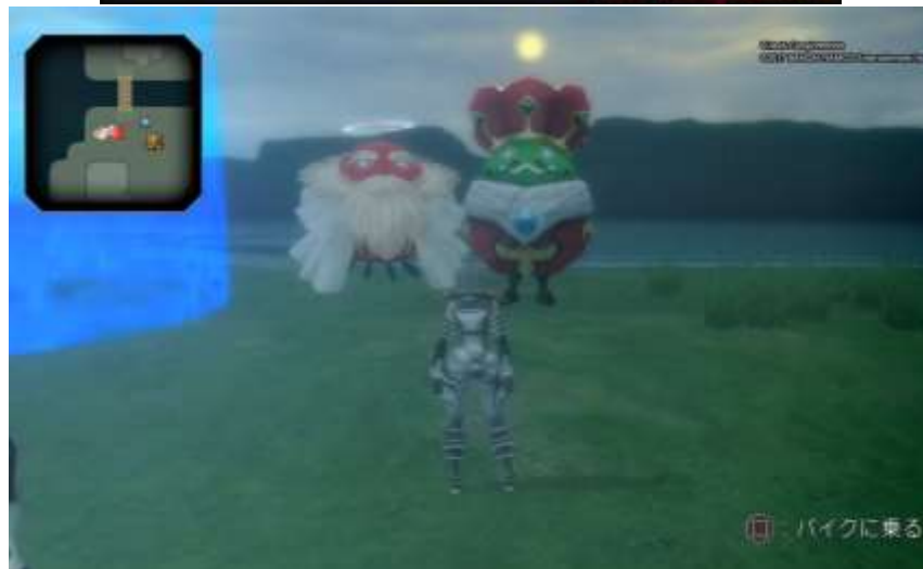
『.hack シリーズ』 株式会社バンダイナムコエンターテインメント©