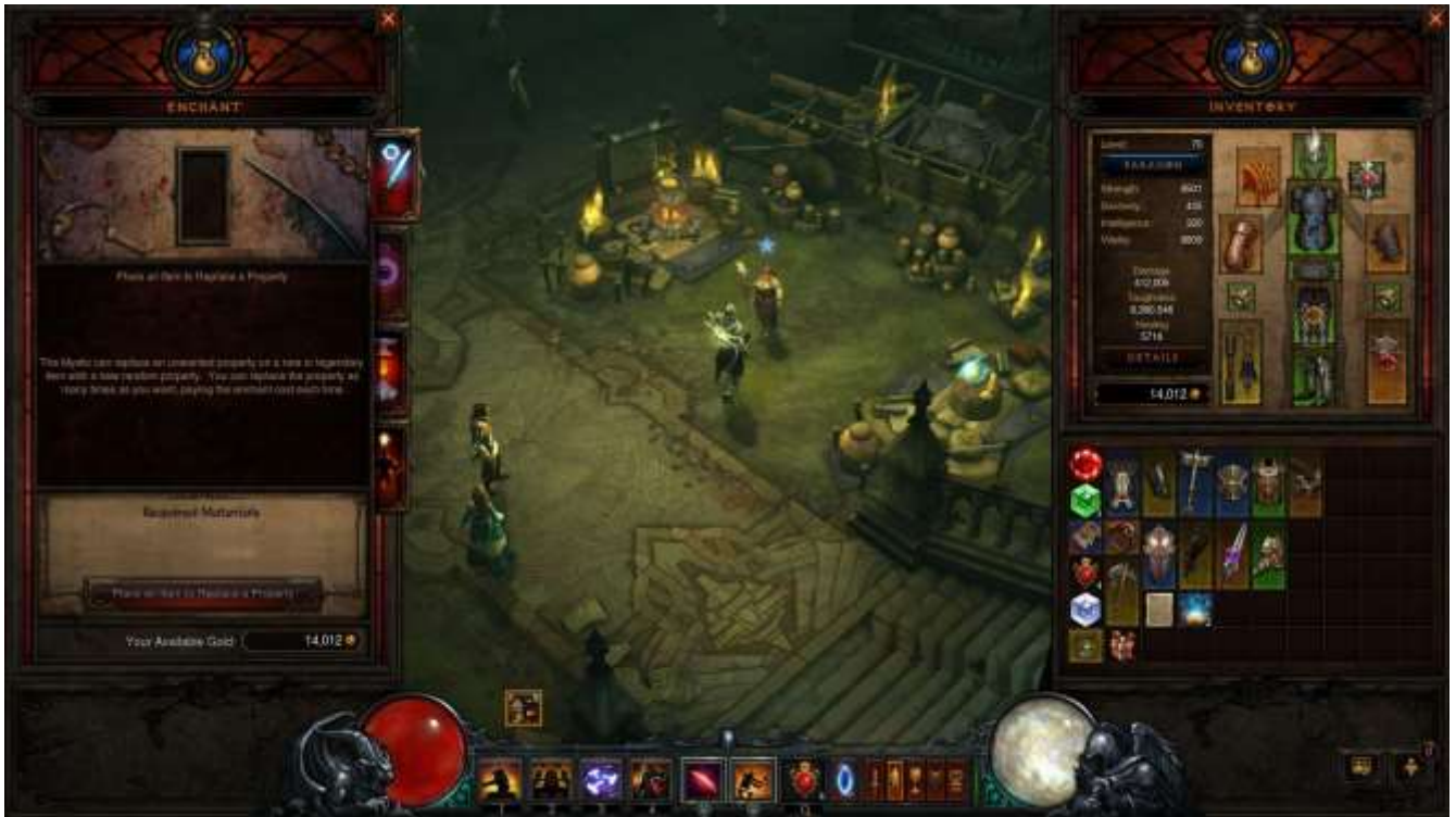
『ディアブロ III』 Blizzard Entertainment, Inc.©