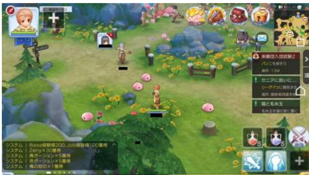
『ラグナロックマスターズ』 ガンホー・オンライン・エンターテイメント株式会社©