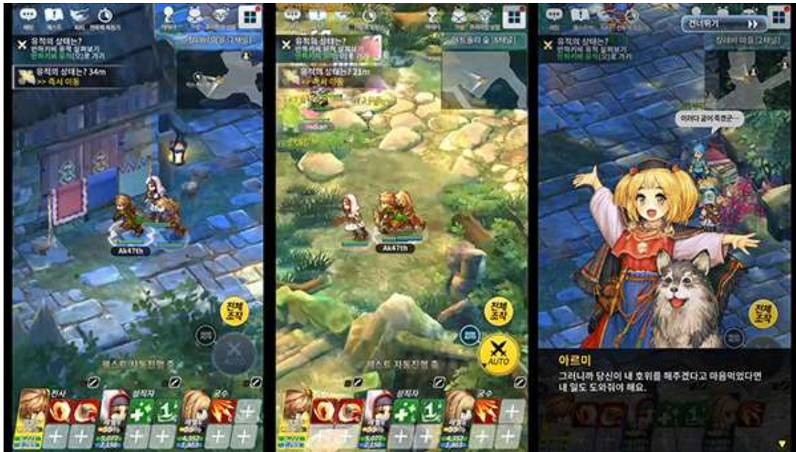
『スピリットウィッシュ』 株式会社ネクソン©