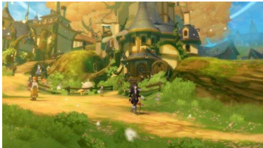
『テイルズ オブ ヴェスペリア』 株式会社ナムコ・テイルズスタジオ©