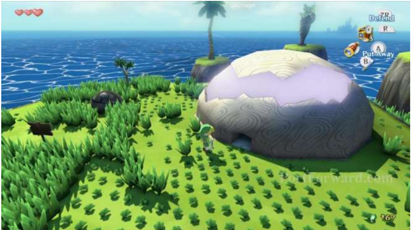
『ツリーオブセイヴァー』