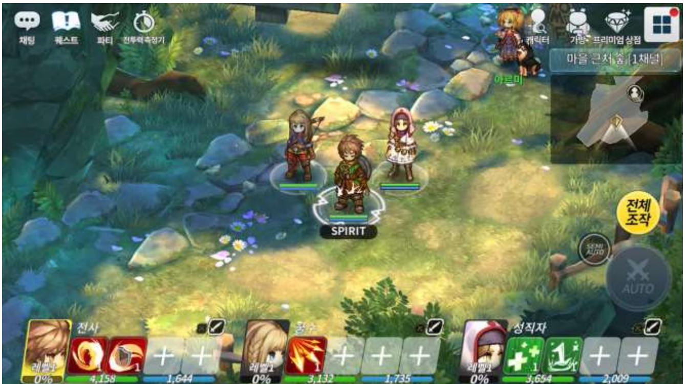
『스피릿유히슈』 株式会社ネクソン©